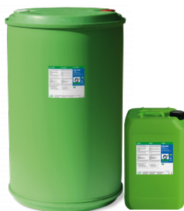
Art.-Nr. 578540-V-50-O Fass 200 l