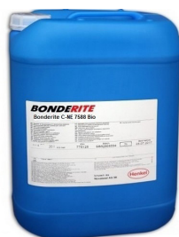
Art.-Nr. 677943-V-50-O Fass 220 kg